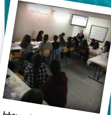
Horn Bad Meinberg