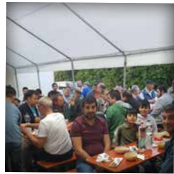
Sonthem a.d. Brenz