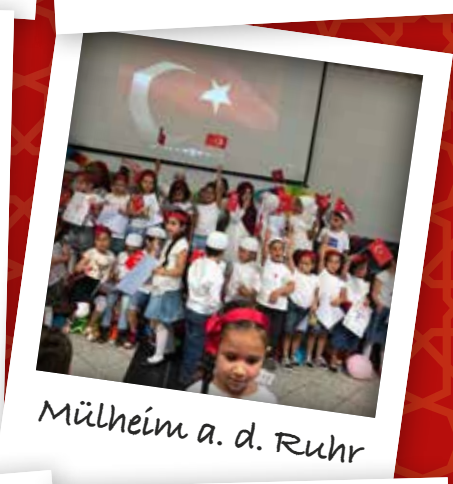
Mülheim a. d. Ruhr